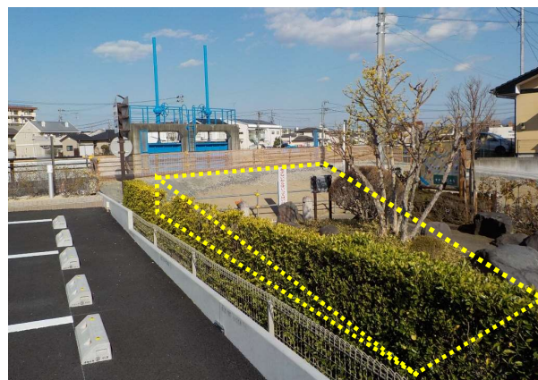
せせらぎ小径完成イメージ