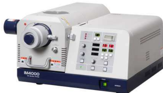
イオンミリング装置外観 (日立ハイテクノロジーズ(株) IM4000Plus 加叻より)