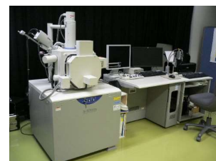
走査型電子顕微鏡 (8,240円/時間)