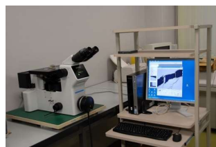
高倍率金属顕微鏡 (1,390円/時間)