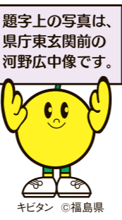
題字上の写真は、県庁東玄閣前の河野広中像です。

明治11年、全国に先駆けて、福島県では県会(県議会)を開設しました。自由民権運動において板垣退助と並び称される河野広中氏は、県会の開設に必要な規則の草案作成などにも尽力した人物で、今年は没後100年にあたります。