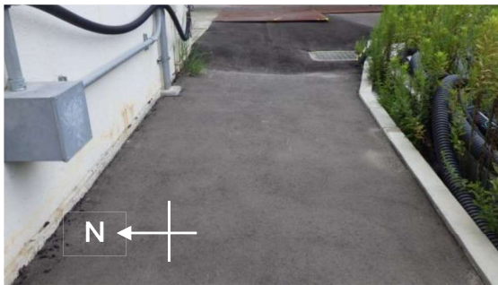
(写真2) 高温焼却炉建屋南側（西側から撮影）