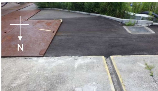
(写真3) 高温焼却炉建屋南側（北側から撮影）