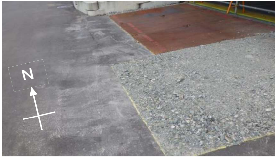
(写真1) サイトバンカ建屋大物搬入口の状況