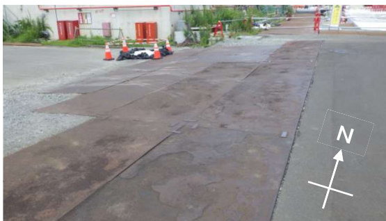
(写真4) 共用プール建屋大物搬入口前道路状況（南東から撮影）