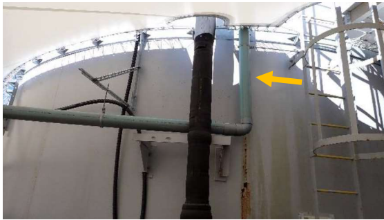
(写真1-2) J8タンクエリアにおける修復済みの 雨樋配管の状況 (黄矢印)