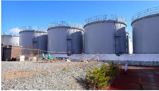
(写真2-1) H6(Ⅱ)タンクエリア外観