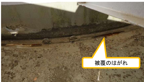
(写真1-4) J8タンクエリア タンク底部にお ける被覆のはがれ