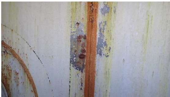
(写真1-3) J8タンクエリア タンク表面の発 錆の状況