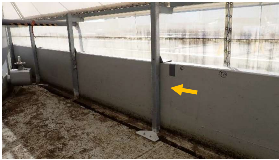
(写真2-2) H6(Ⅱ)タンクエリアにおける修復済みの雨水カバー支柱の状況(黄矢印)