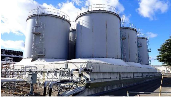
(写真1-1) J8タンクエリアの外観