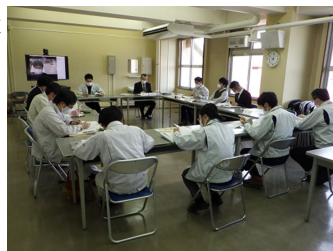
林業普及指導推進会議の様子