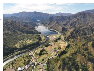
ほ場整備地区（只見町只見）

1つ目は、中山間地域総合整備事業です。南会津西部地区と下郷地区で引き続き実施します。これまではほ場整備や防災行政無線などの整備を進めてきた南会津西部地区は、水路工事や道路工事、下郷地区は、来年4月の供用開始を予定している芦ノ原工区や、三ツ井工区の営農飲雑用水施設整備工事を中心に実施予定です。また、事業実施前の調査地区として、只見地区で2年目調査を実施します。