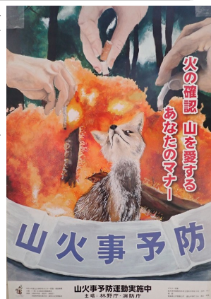
山火事予防ポスター