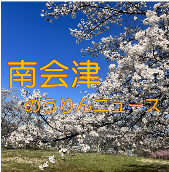
今号の写真:南会津町の桜