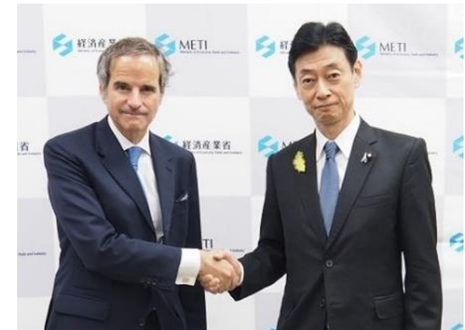
グロッシー事務局長と西村経済産業大臣