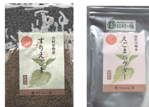
【どちらか1つプレゼント】