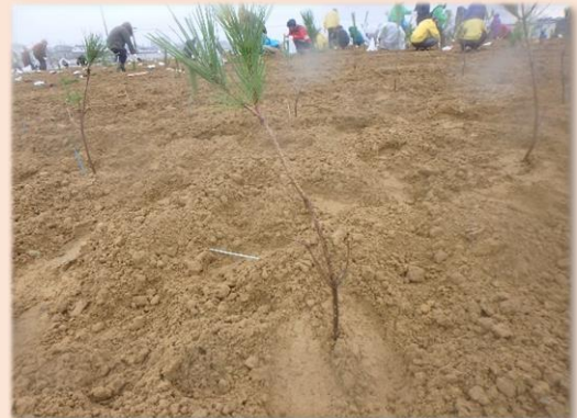
▲ 筆者が植えたクロマツの苗木