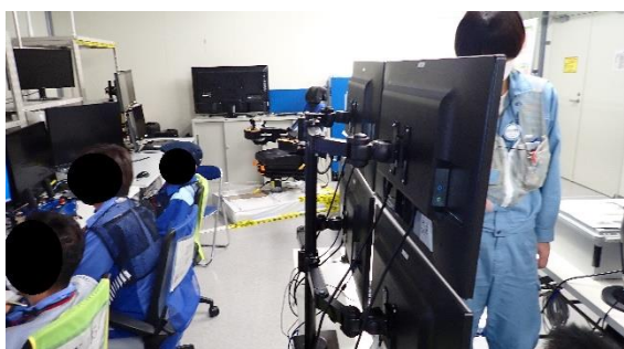
(写真1) 遠隔操作室における作業の状況