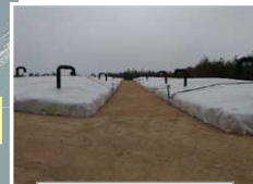
伐採木一時保管槽