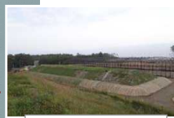
覆土式一時保管施設