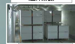
固体廃棄物貯蔵庫