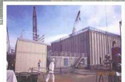
廃スラッジ一時保管施設