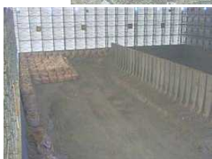
瓦礫保管 テント内