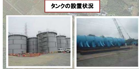
タンクの設置状況