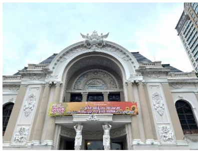
↑ホーチミン市民劇場