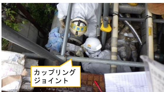
(写真1-1) カップリングジョイント部の遊間計測の実施状況(1)