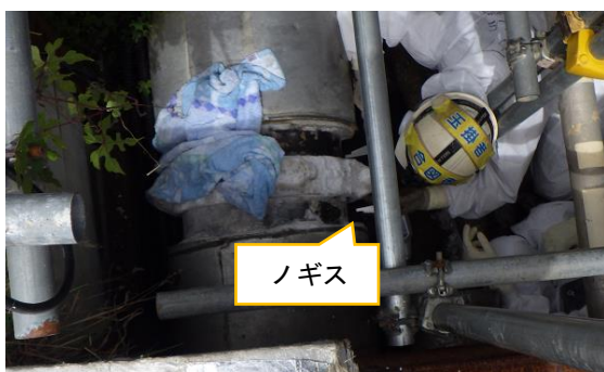
(写真1-2) カップリングジョイント部の遊間計測の実施状況(2) ノギスを使った遊間計測