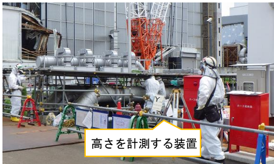
(写真2) 配管の高さ方向の計測状況