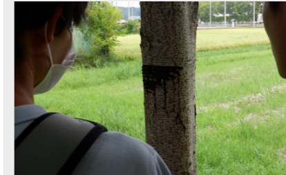
※写真は全て令和4年度のものです。