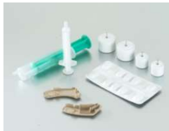
医療部品中のステンレ ス製製品の評価