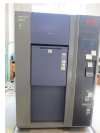
熱衝撃試験機 (1,450円/時間)