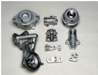
自動車部品中の シャフト材の評価