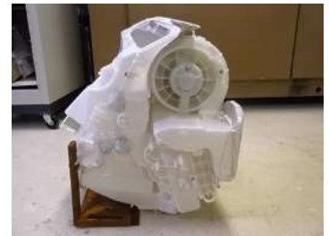
モーター試作品の評価