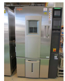
低湿度型恒温恒湿槽 (600円/時間)