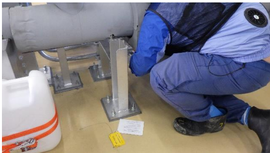
(写真1) ストレーナ清掃作業の状況