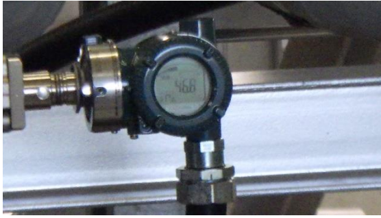
(写真 2 - 2) 圧力計の状況 (清掃後、46.9 kPa)