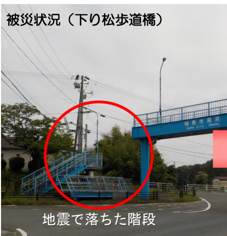
地震で落ちた階段