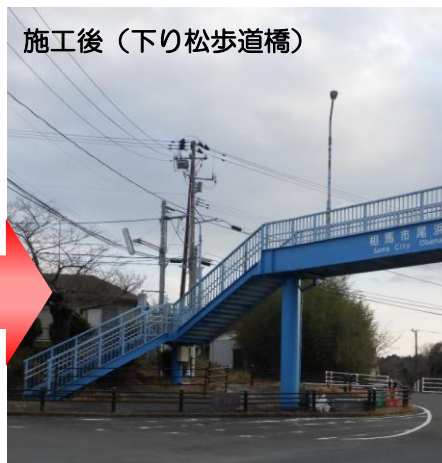
施工後（下り松歩道橋）