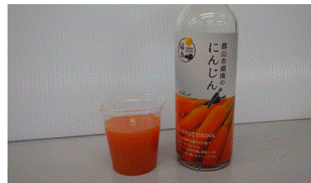
【試食・試飲イメージ】