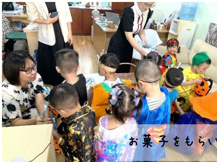
お菓子をもらいにお隣のセンターへ