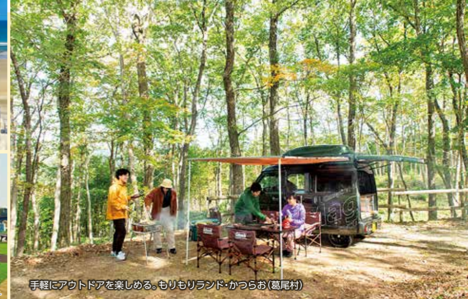
手軽にアウトドアを楽しむ。もりもりランド・かつらお (葛尾村)