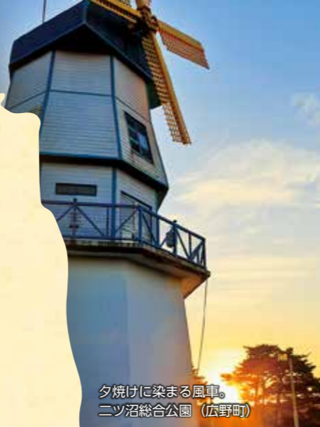
夕焼けに染まる風車。ニッ沼総合公園 (広野町)