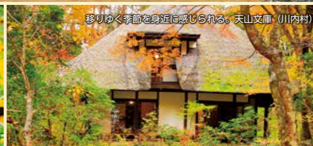
移りゆく季節を身近に感じられる。天山文庫 (川内村)