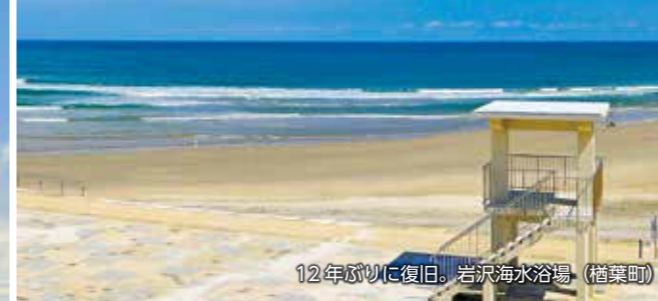
12年ぶりに復旧。岩沢海水浴場 (楢葉町)