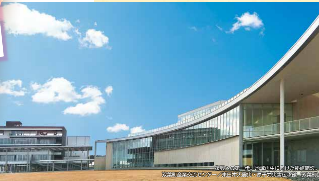
復興への第一歩。地域再生に向けた拠点施設。双葉町産業交流センター/東日本大震災・原子力災害伝承館 (双葉町)