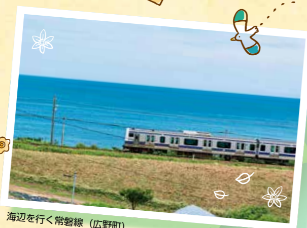
海辺に行く常磐線 (広野町)

車窓から眺めるとどこまでも続く大海原も。ホームを吹き抜けていくさわやかな風も。のんびりと電車が揺られてめぐる旅には、心に響くいくつもの感動があります。