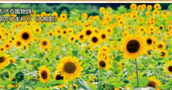
夏を告げる風物詩。大川原のひまわり (大熊町)