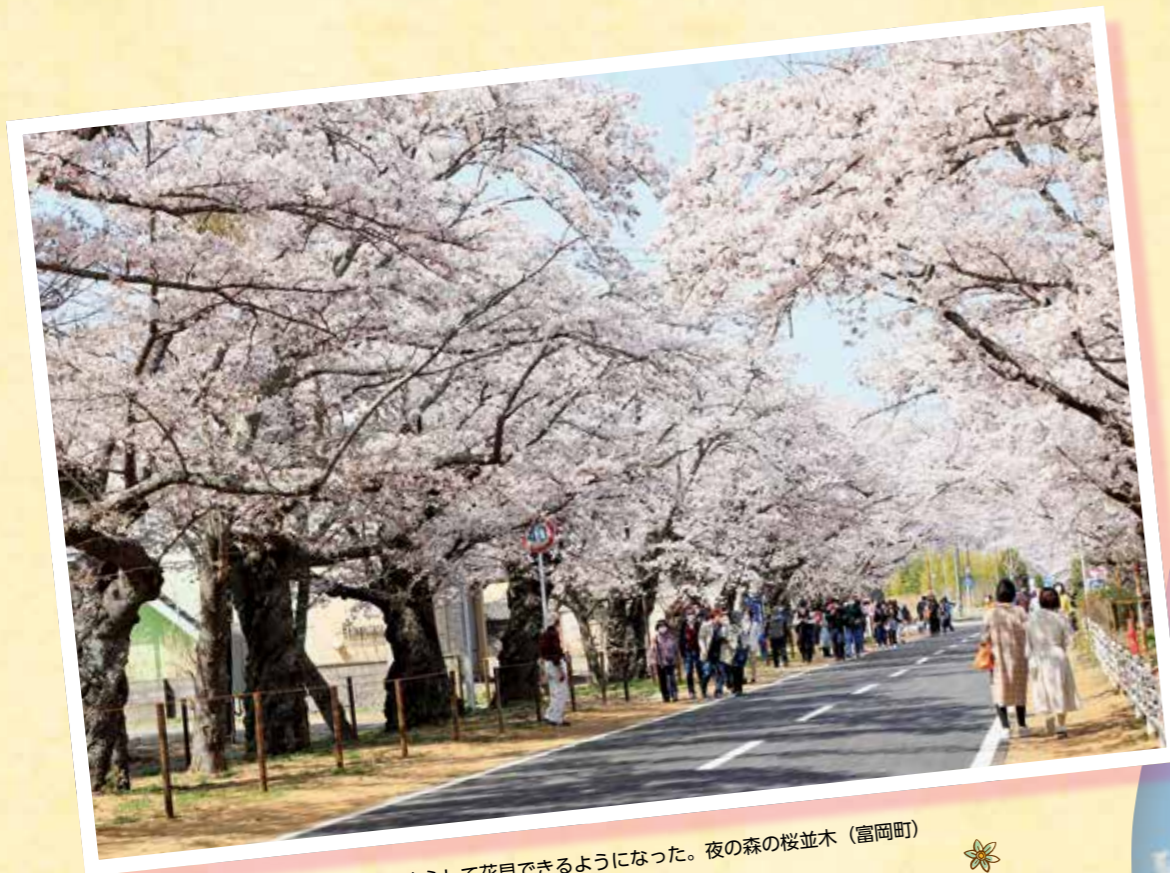
2023年4月、避難指示解除により安心して花見できるようになった。夜の森の桜並木 (富岡町)