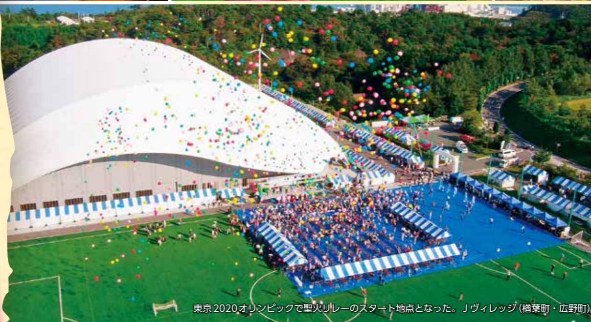
東京2020オリンピックで聖火リレーのスタート地点となった。Jヴィレッジ (楢葉町・広野町)