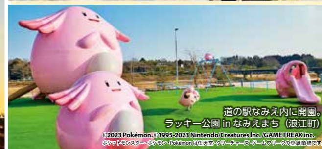
道の駅なみえ内に開園。ラッキー公園 in なみえまち (浪江町) ポケモンモンスター・ポケモンは任天堂・クリエーターズ・ゲームフリークの登録商標です。