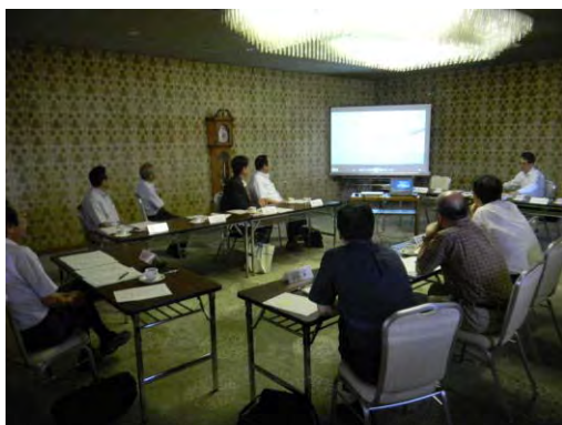
福島県の森林文化に係る 調査検討委員会の開催