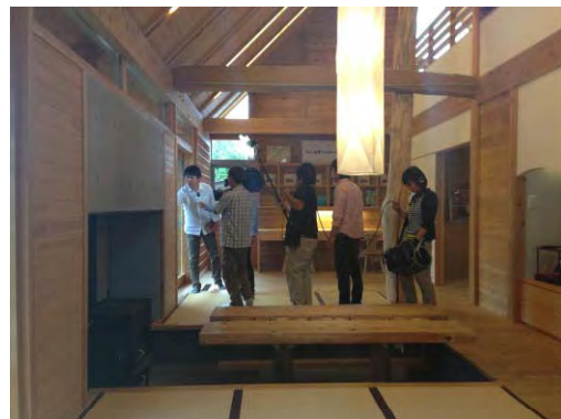
本事業をPRするテレビ取材の様子（福島市）