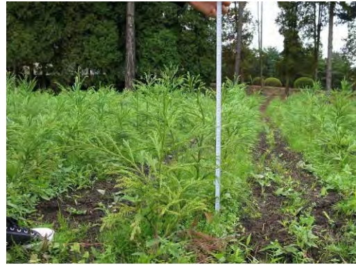
花粉対策品種のさし付け状況