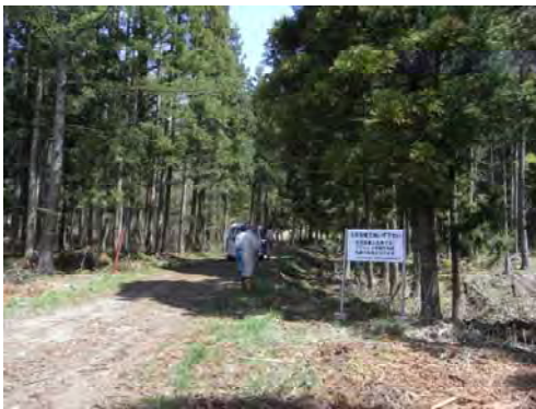
調査地点の事前調査の様子