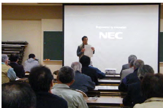
講話「森林の役割」の様子