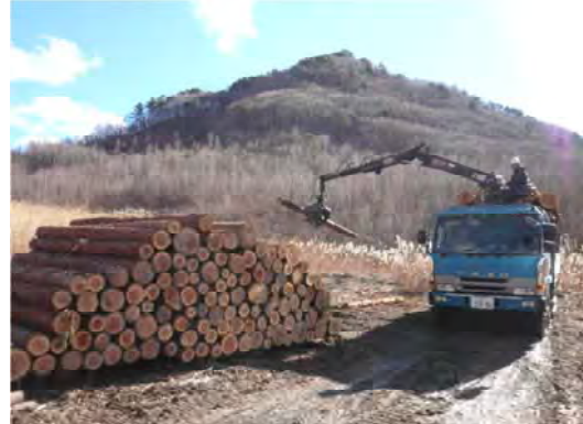
林内作業路整備支援事業により開設した 作業路を利用した間伐材の搬出(南会津町)