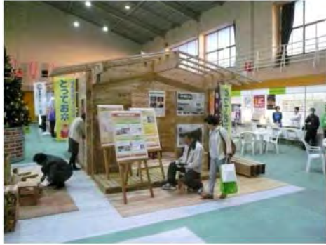
住宅モデルを展示したイベント （ふくしまみんなの住宅フェア）