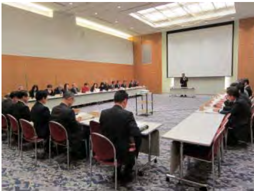
全国植樹祭福島県準備委員会の開催