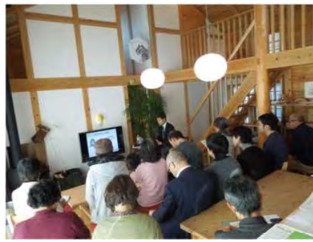
家づくりワークショップ（木の家講座）