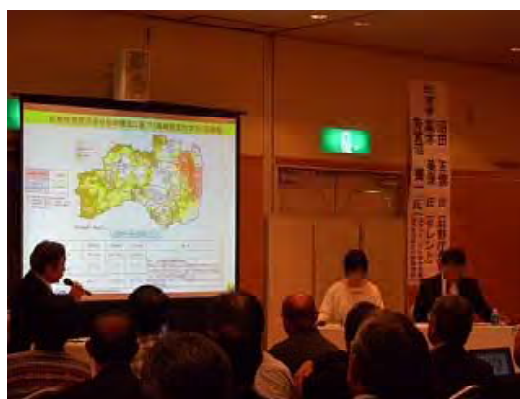
林業復興鼎談の実施