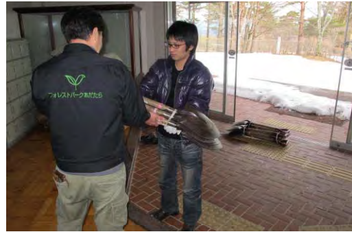
サポートセンターの活動の様子