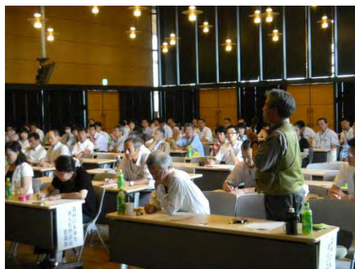
森林環境基金事業成果発表会の様子