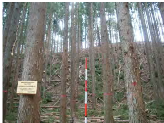
森林整備(間伐)実施後状況(西郷村)