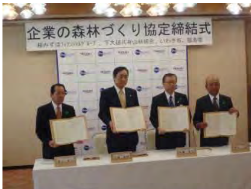
平成25年4月24日 企業の森林づくり協定締結