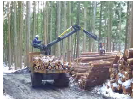
作業道の利用状況(国見町)