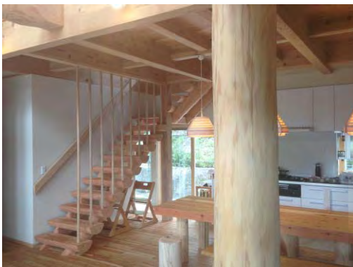
本事業を活用した住宅の内観（下郷町）