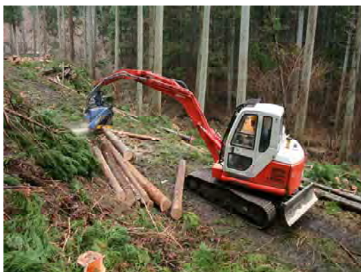
作業の様子(福島市)