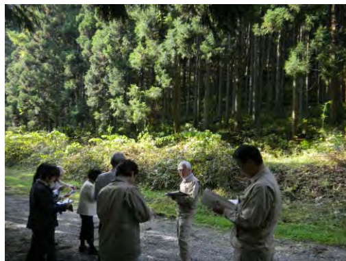
森林の未来を考える懇談会 現地調査の様子