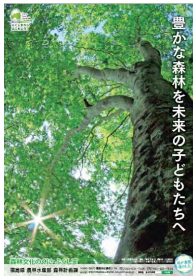
森林環境情報パンフレット・ポスター