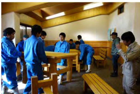
新「ほっと」スペース創出事業 会津農林高等学校の生徒による 製品設置（福島県昭和の森）