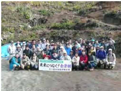
桐苗木植栽体験終了後の記念撮影

木（森）に由来する伝統文化継承事業体験イベント開催業務を会津流域林業活性化センターに委託し、「未来につなごう！会津桐」をテーマに、三島町において、桐苗木植栽及び桐下駄づくり体験を実施した。