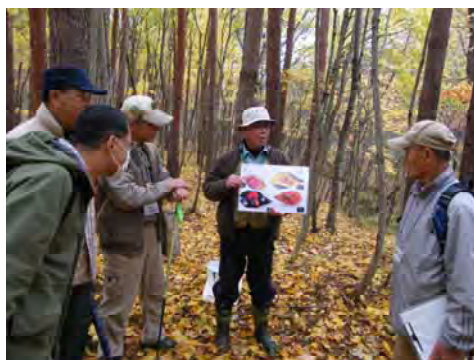
講座「森林内での野外活動」の様子