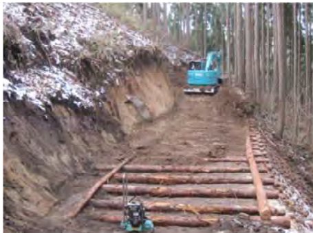
作業道の作設状況(田村市)

水源区域及び水源かん養機能又は山地災害防止機能を重視する森林に対して、継続的な森林整備の促進を図るため、トラックが通行可能な耐久性のある作業道を開設する経費を助成した。