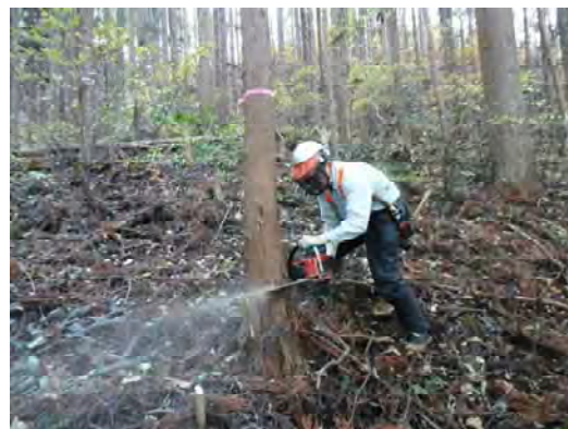
林業機械による作業の様子(いわき市)