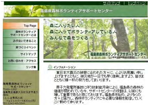
森林ボランティアサポートセンターHP

森林ボランティアサポートセンターを引き続き「県民の森」内に設置し、ホームページ及び広報誌（森ボラ新聞4回発行）によるイベントなどの情報提供、相談業務、森林整備機材の貸出等を行った。（アクセス件数(4～1月)：67,141件、平均：6,714件/月）