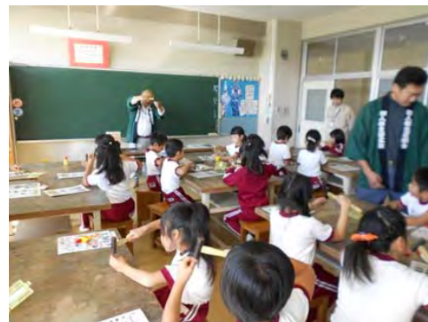
木とのふれあい創出事業 いわきで開催された出前講座