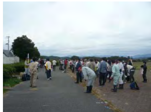
平成25年10月19日 企業の森林づくり活動