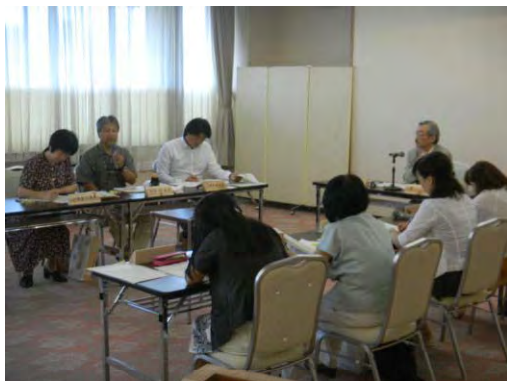
森林の未来を考える懇談会 開催の様子

平成25年度事業の進捗状況、平成26年度事業の概要、 森林環境情報発信の取組について、 全国植樹祭福島県準備委員会の検討状況について