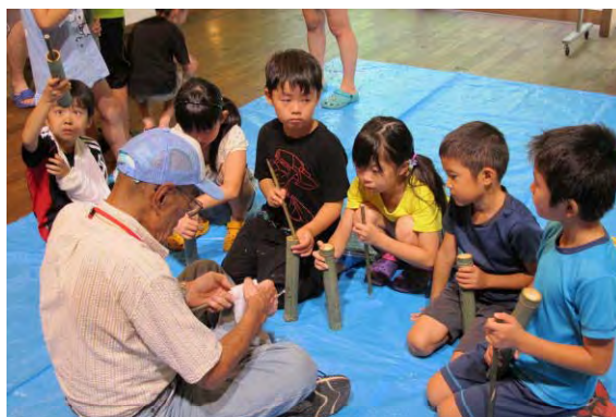
県民の森での公開体験プログラムの実施