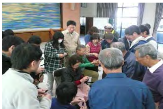
桐下駄鼻緒付け体験の様子