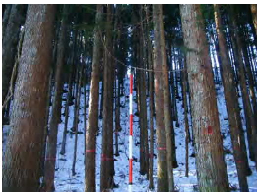
森林整備(間伐)実施前状況(西郷村)