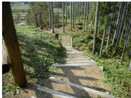
県民参画の推進(石川町)