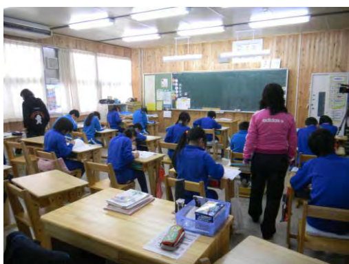
県産材の利活用推進(飯館村)