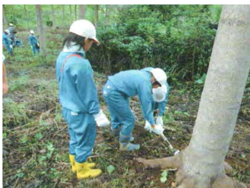
森林環境学習の推進(三島町)

森林環境学習実施校 小学校281校、中学校76校、計357校 (全736校の49%)