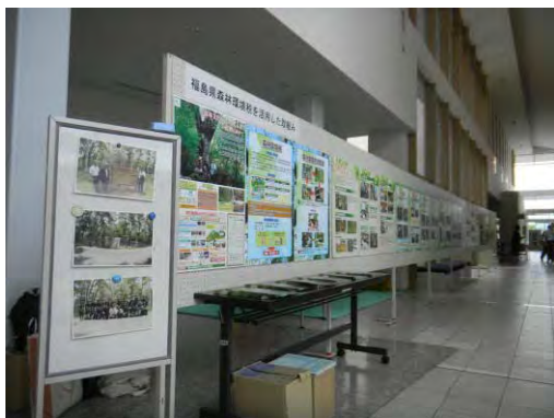
全国的なイベントでのPR (平成25年7月11日、南会津町御蔵入交流館)

新聞広告、県政テレビ番組、ポスター及びパンフレット等により、森林環境税を活用した取組のほか、森林の整備と再生や県産材の利活用、森林づくりの推進などについての発信した。