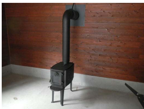
木質バイオマスの利活用推進(鮫川村)