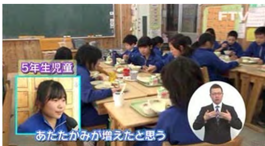
県政広報テレビ番組 「キビタンGO! ～ふくしまから はじめよう。～ 森林(もり)を守り育て未来へつなごう」 (平成26年2月25日、福島テレビ)