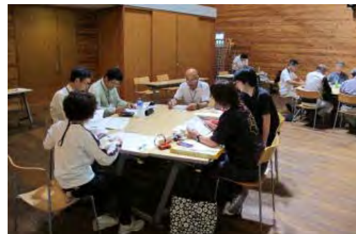
第3期もりの案内人養成講座の開催状況