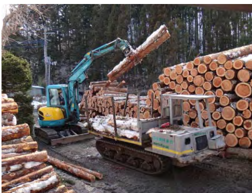
間伐材搬出支援事業による 間伐材運搬のための積み込み

間伐材の利用促進を図るため、間伐材の搬出に必要な作業路の整備及び原木市場、木質燃料加工施設等への間伐材の運搬を支援した。