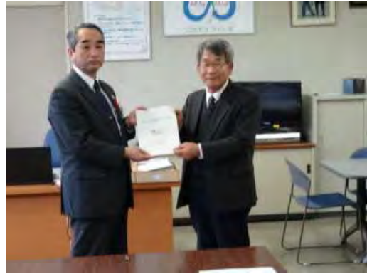
森林づくり活動推進についての提言