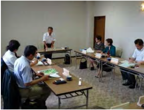
森林づくり検討委員会開催