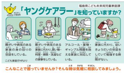
ヤングケアラーカード 表

県内の全ての小・中・高校、特別支援学校の全生徒に向けて、ヤングケアラーカードとSNS相談のチラシを配布。