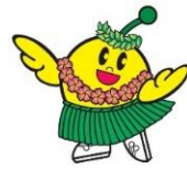
フラキビタン

書類の作成が不安な場合は、 お手伝いいたします！ 申請前のご相談・お問い合わせも 受け付けていますので まずはお気軽にご相談ください♪