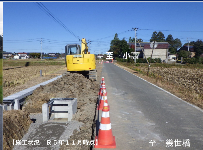
【施工状況 R5年11月時点】

問合せ先：福島県相双建設事務所 企画調査課 TEL0244-26-1228 FAX0244-26-1197