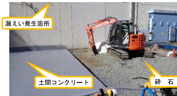
(写真2-1) 汚染土壌撤去後の状況① (東側から撮影)