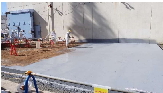
(写真3-1) ポリウレア吹き付け作業の状況① (北東側から撮影)