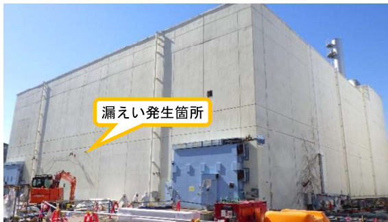
(写真1) 高温焼却炉建屋の外観 (北東側から撮影)