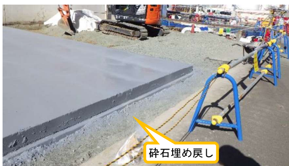
(写真2-2) 汚染土壌撤去後の状況② (南東側から撮影)