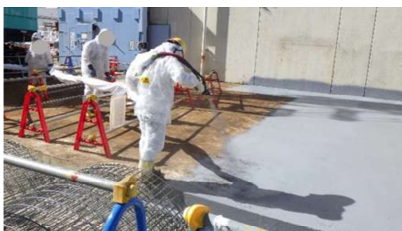
(写真3-2) ポリウレア吹き付け作業の状況② (北東側から撮影)