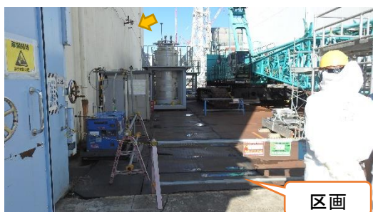
(写真3) ベントロ (矢印) と漏えい範囲の状 況 (南から撮影)