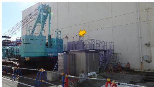
(写真1) HTI 建屋東面とベントロの状況 (北東から撮影)