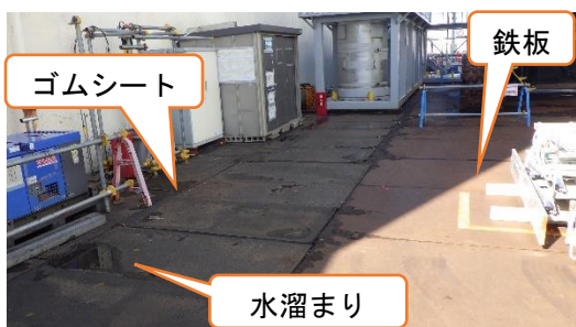
(写真4) 漏えい範囲の状況