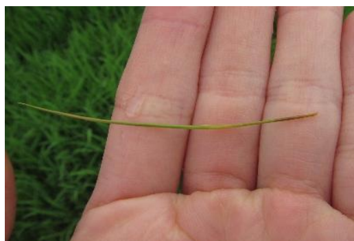
図6 もみ枯細菌病により腐敗した新葉 葉鞘基部が褐変し、引っ張ると簡単に抜ける。