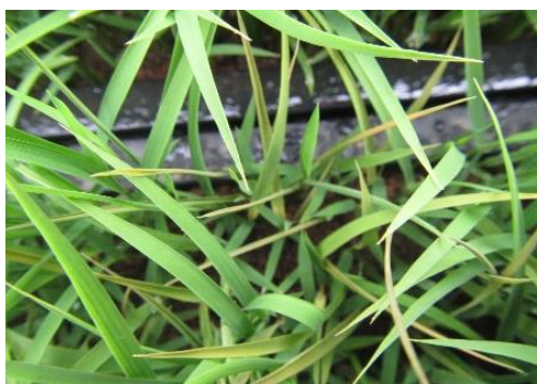
図5 もみ枯細菌病の罹病苗 新葉が腐敗・枯死している。