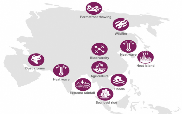
図2 アジアの気候変動に関する主なリスクの分布