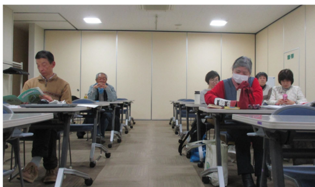
3月2日の会合の様子

3月2日9時から12時まで福島市内のアオウゼで7名が参加して県北の会の会合が開催されました。