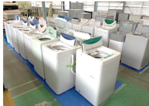
リサイクルショップ

大学で学んできた「実工学」で培った知識 と地域活動やボランティアの経験を活かし て、集落の活性化を支援したい。