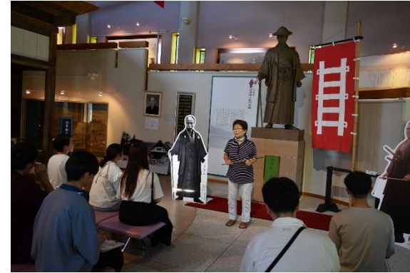
河井継之助記念館