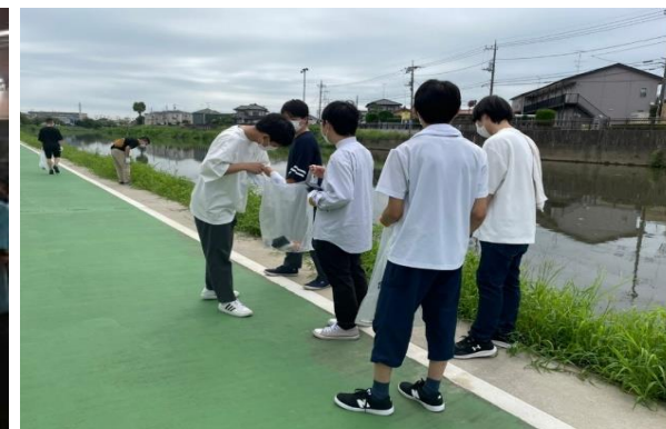
全国学生清掃週間 (NSCWeek)