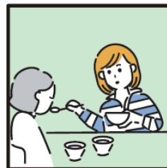
障がいや病気のある家族の身の回りの世話をしている。