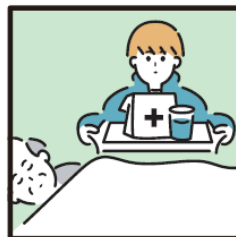
がん・難病・精神疾患など慢性的な病気の家族の看病をしている。