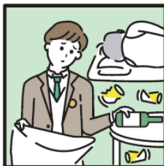
アルコール・薬物・ギャンブル問題を抱える家族に対応している。