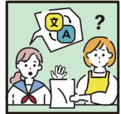
日本語が第一言語でない家族や障がいのある家族のために通訳をしている。