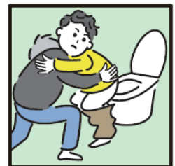
障がいや病気のある家族の入浴やトイレの介助をしている。

ヤングケアラーの支援については 市区町村の「こども家庭センター」 又は児童福祉担当部署までご連絡ください