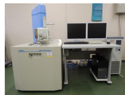
走査型電子顕微鏡 (5,650円/時間)

○その他の施設・設備は、福島県ハイテックプラザ 施設・設備データベースからご覧いただけます。