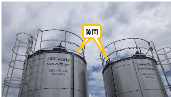
(写真1①) シェルノンタンク