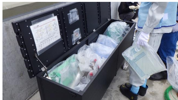
(写真3) 漏えい時対応物品