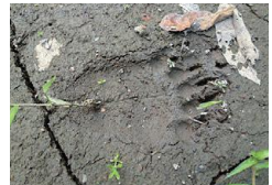
クマの足跡 成獣であれば 手のひらサイズ