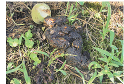
クマのフン 握りこぶし程度の大きさ、 臭い匂いはしない