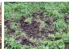
掘り起こし痕 イノシシがミミズ等の エサを探した痕