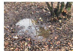
ぬた場 イノシシが どろ浴びした痕