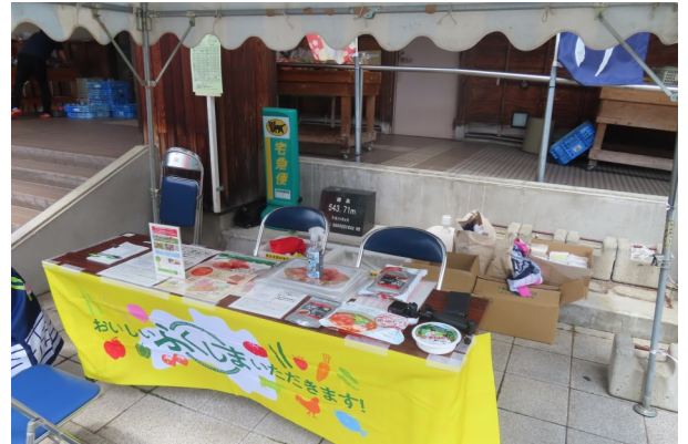
第2回キャンペーンの様子

当事務所ではこれからも南会津地域の農林産物の魅力発信、消費拡大に努めてまいります。