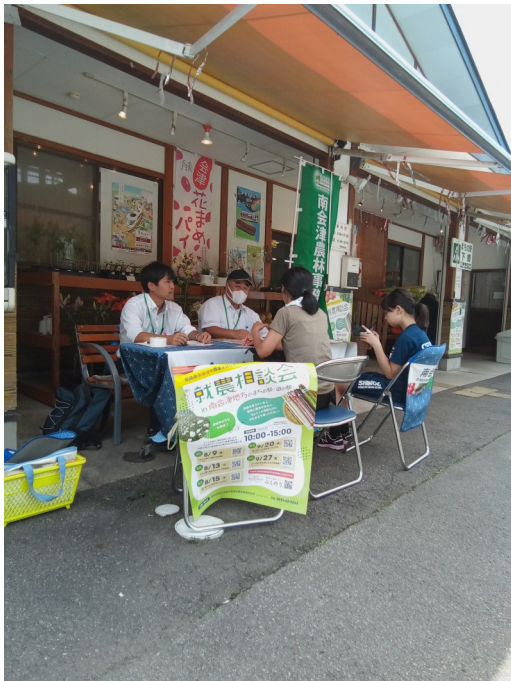
相談会の様子 8/9 下郷町物産館

就農相談会は9月20日(場所:山口温泉きらら289)、27日(場所:南会津ふるさと物産館)にも開催します。当事務所では、このような就農相談会などを通じて、新規就農者の確保を図ってまいりたいと考えています。