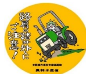
農林水産省 作業安全ステッカー

また、全国的に農作業事故で死亡する高齢者の割合が高くなっております。御家族や御近所の高齢な農業者の方に対して、日々の声かけにより、安全な農作業に対する意識を高めましょう。声かけをする際は、具体的な危険箇所、注意点を伝えるとより効果的です。