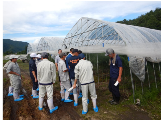
生産者の話を聞く生徒 (左:7/5の様子 右:7/18の様子)