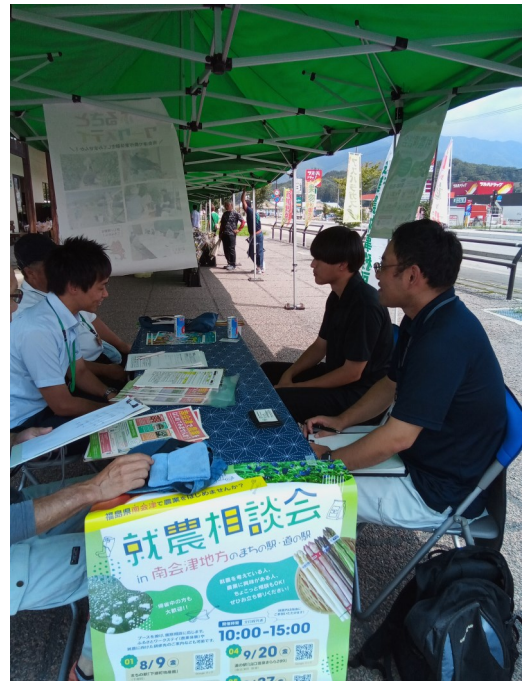
相談会の様子 8/13 南会津ふるさと物産館