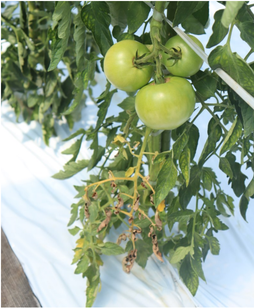
今号の写真：南郷トマト（南会津町）