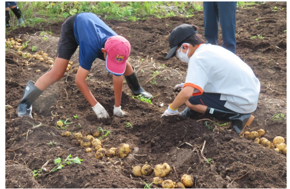
農家民泊での農作業体験

( https://www.pref.fukushima.lg.jp/sec/36250a/noukamimpaku-actionplan.html )