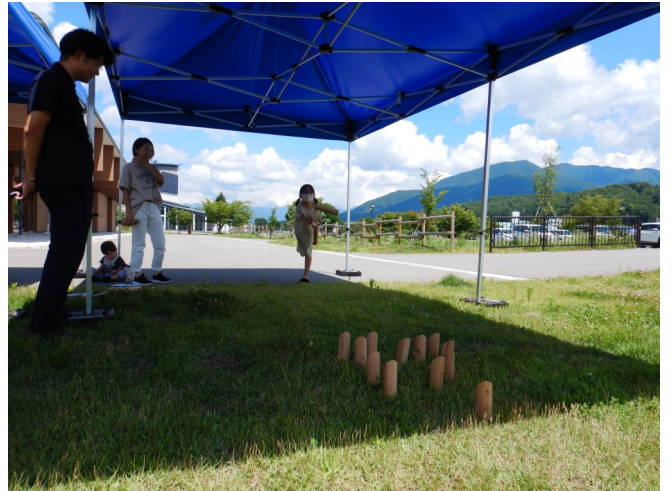
「木であそ棒」で遊ぶ様子

このため、今後も様々な機会により多くの方々に森林・林業への関心を持ってもらえるよう努めてまいります。