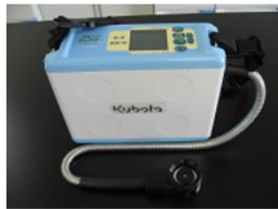
8. フルーツセレクター

近赤外線により果実をつぶすことなく、糖度と酸度が測定できます。リンゴ、トマトは糖度と酸度が測定できます。モモ、ブドウ、カキ、ナシ、メロン、イチゴ、小玉スイカは糖度のみ測定できます。