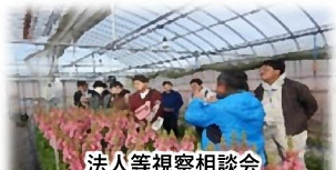
法人等視察相談会