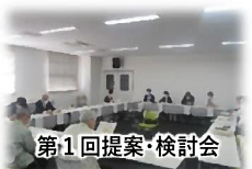
第1回提案・検討会