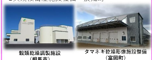
穀類乾燥調製施設 (相馬市)