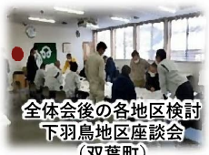
全体会後の各地区検討 下羽鳥地区座談会 (双葉町)