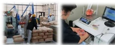
安全な農林水産物を消費者へ

米の全量全袋検査（12月末） 【R5実績】78,423点 野菜等のモニタリング検査 【R5実績】687点 県産材（製品材）の表面放射線量測定【R5実績】60検体