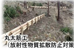
丸太筋工 （放射性物質拡散防止対策）