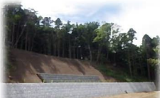
南川原地区（南相馬市）