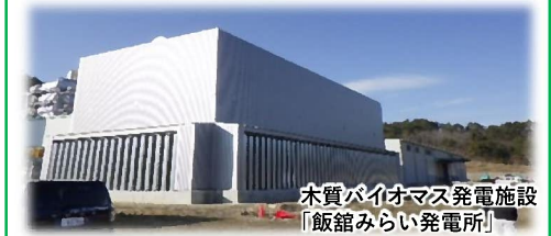
木質バイオマス発電施設 「飯館みらい発電所」