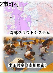
森林クラウドシステム 木工教室（南相馬市）