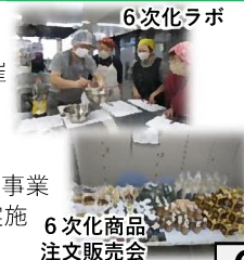
6次化商品 注文販売会