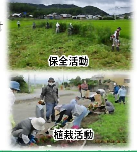
保全活動 植栽活動