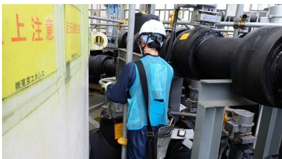
(写真6-1) タンク (E) の出口弁「開」の操作状況