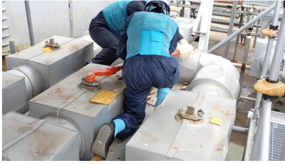
(写真3-1) グループ1排水弁の「全開」作業状況