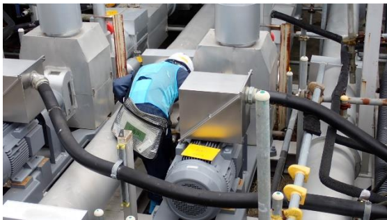
(写真4) 放水ポンプ起動後の確認状況