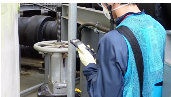
(写真6-2) スマートフォンを用いたクロスチェックの実施状況