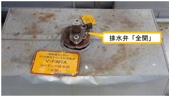
(写真3-2) グループ1排水弁の「全開」状況