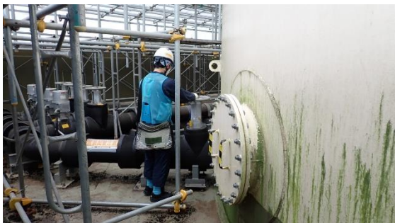
(写真5) タンク (E) 以外の出口弁「閉」の確認状況