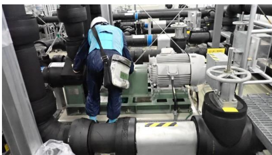
(写真7) 浄化水移送ポンプ (A) 起動後の確認状況