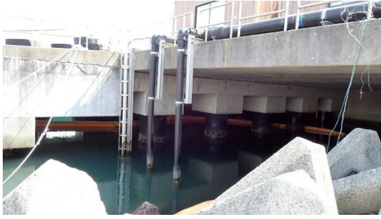
(写真8) サブドレン処理水排水口の状況