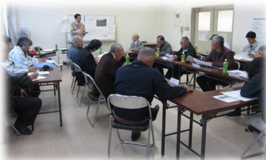
写真 連絡調整会議の様子

平成25年11月29日、好間地区連絡調整会議において、好間川の親水施設整備について、意見交換が行われました。 親子が一緒に水辺で遊べる環境を作るために、安全に河川敷へ下りることができる階段を、松坂吊り橋の下流右岸側に設置することとなりました。