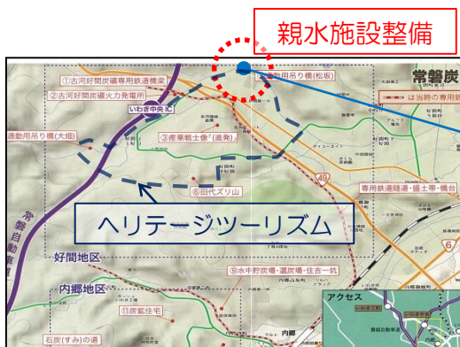
図 親水施設整備位置図