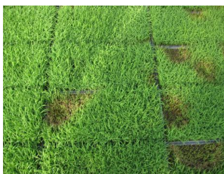
写真2 もみ枯細菌病