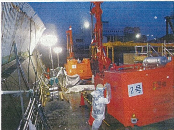
写真① 1BLK削孔状況(2セット)