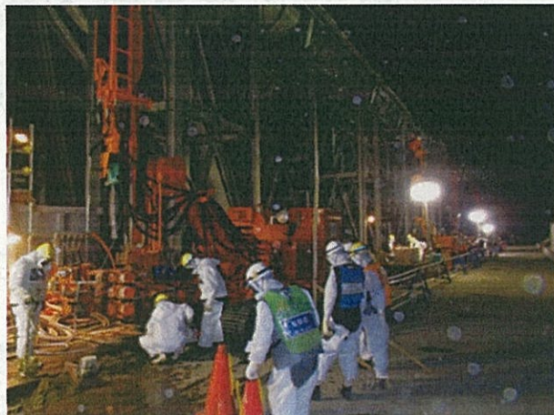
写真② 8BLK削孔状況(4セット)