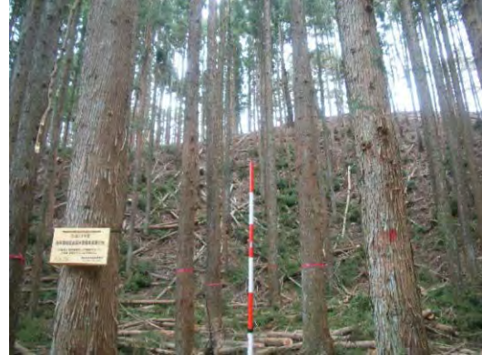
森林整備(間伐)実施後状況(西郷村)