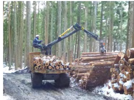
作業道の利用状況(国見町)