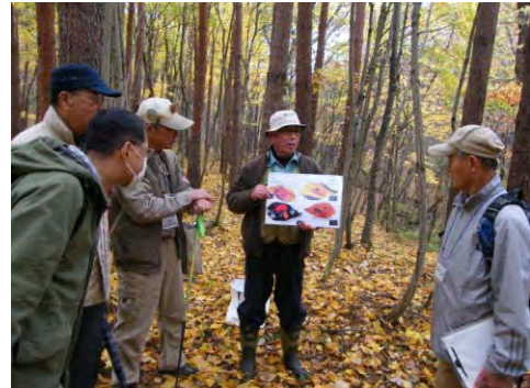
講座「森林内での野外活動」の様子