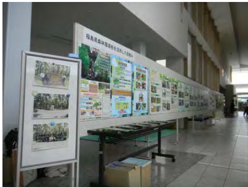
全国的なイベントでのPR (平成25年7月11日、南会津町御蔵入交流館)

新聞広告、県政テレビ番組、ポスター及びパンフレット等により、森林環境税を活用した取組のほか、森林の整備と再生や県産材の利活用、森林づくりの推進などについての発信した。