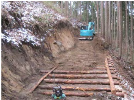
作業道の作設状況(田村市)

水源区域及び水源かん養機能又は山地災害防止機能を重視する森林に対して、継続的な森林整備の促進を図るため、トラックが通行可能な耐久性のある作業道を開設する経費を助成した。