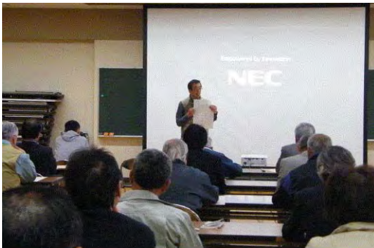
講話「森林の役割」の様子