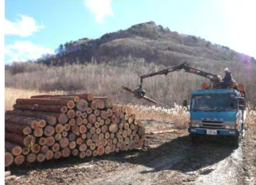
林内作業路整備支援事業により開設した 作業路を利用した間伐材の搬出(南会津町)