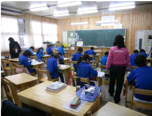
県産材の利活用推進(飯館村)