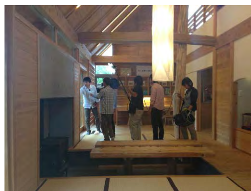
本事業をPRするテレビ取材の様子（福島市）