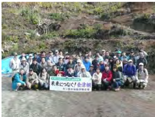
桐苗木植栽体験終了後の記念撮影