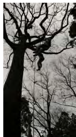
ツリークライミングの実習

ツリークライミングを通して森林の魅力を感じるとともに、仕事にも応用できる技術と考え、高校卒業後の進路を重ねる生徒もいた。講演会では実際の体験談や自分自身で仕事をつくっていく行動力に生徒は感銘を受け、職業選択の選択肢の一つとして、積極的に林業を考えたいという生徒が増えた。小学校との交流事業は昨年度より1校増え3校と交流した。また、県の農林事務所から梯子を借り、例年より高い位置まで枝打ちの実習ができた。