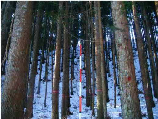
森林整備(間伐)実施前状況(西郷村)