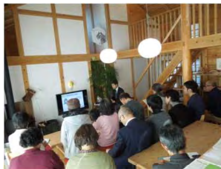
家づくりワークショップ（木の家講座）