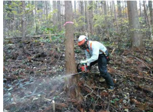
林業機械による作業の様子(いわき市)