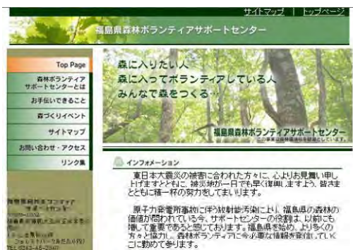
森林ボランティアサポートセンターHP

（ホームページアクセス件数(H25.4～H26.3) 77,879件、平均6,490件/月）