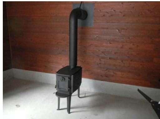
木質バイオマスの利活用推進(鮫川村)