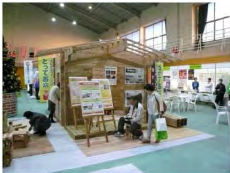
住宅モデルを展示したイベント （ふくしまみんなの住宅フェア）