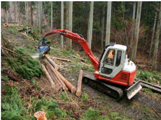
作業の様子(福島市)