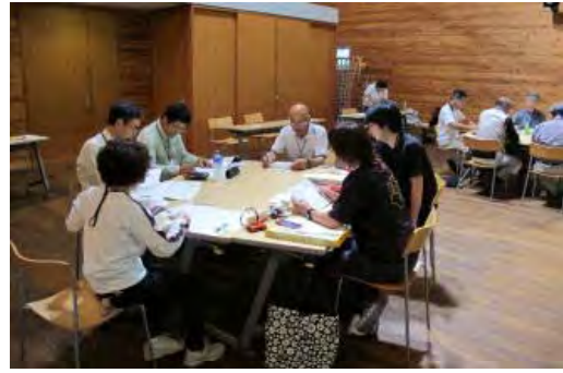
第3期もりの案内人養成講座の開催状況