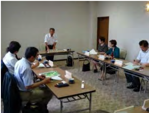
森林づくり検討委員会開催