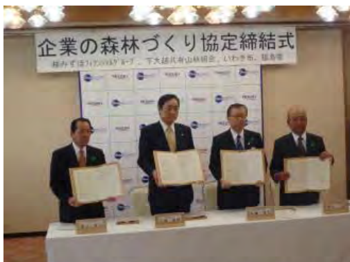
平成25年4月24日 企業の森林づくり協定締結