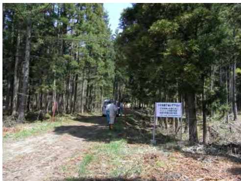
調査地点の事前調査の様子