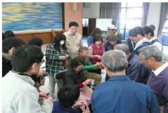
桐下駄鼻緒付け体験の様子