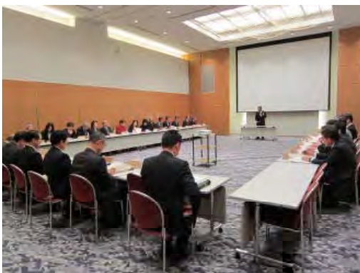
全国植樹祭福島県準備委員会の開催