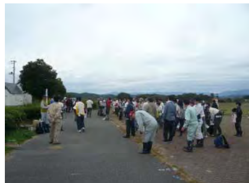
平成25年10月19日 企業の森林づくり活動