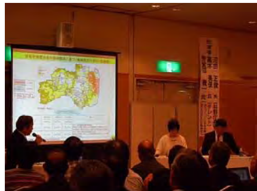
林業復興鼎談の実施