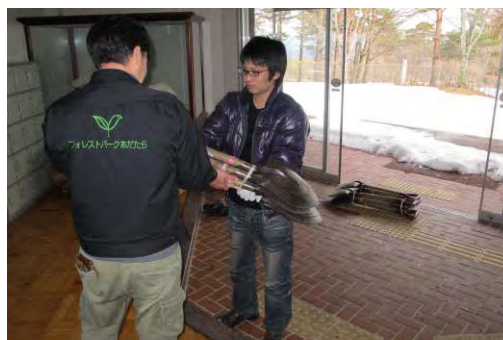
サポートセンターの活動の様子