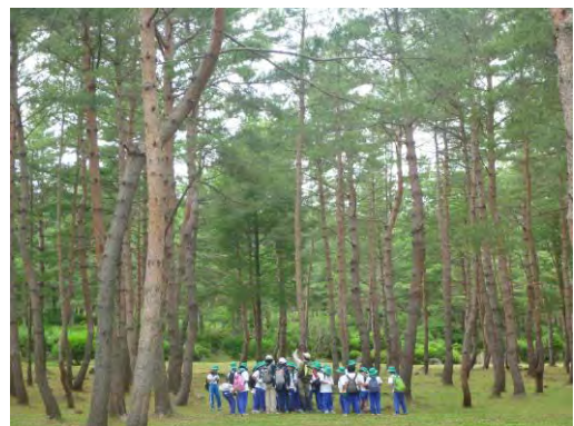
第21回全国植樹祭(昭和45年)会場の 現在の様子(猪苗代町 昭和の森)