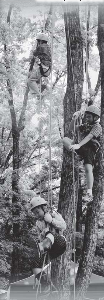
「挑戦」 撮影地/三島町 (第28回ふくしま緑の写真コンクール金賞作品)