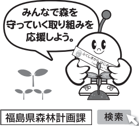
福島県森林計画課 検索