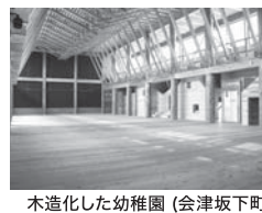
木造化した幼稚園 (会津坂下町)

県では、森林を公共建築物の木造化・木質化、応急仮設住宅や復興公営住宅に県産材を積極的に利用するとともに、県産材を使用した住宅の普及活動などを支援しています。