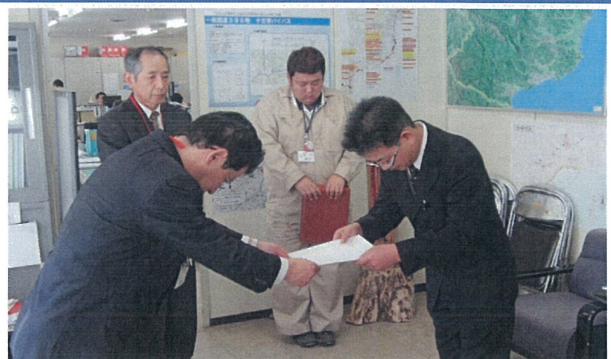
(いわき建設事務所長から点検サポーターの方へ委嘱状を手渡す様子：平成26年11月18日)