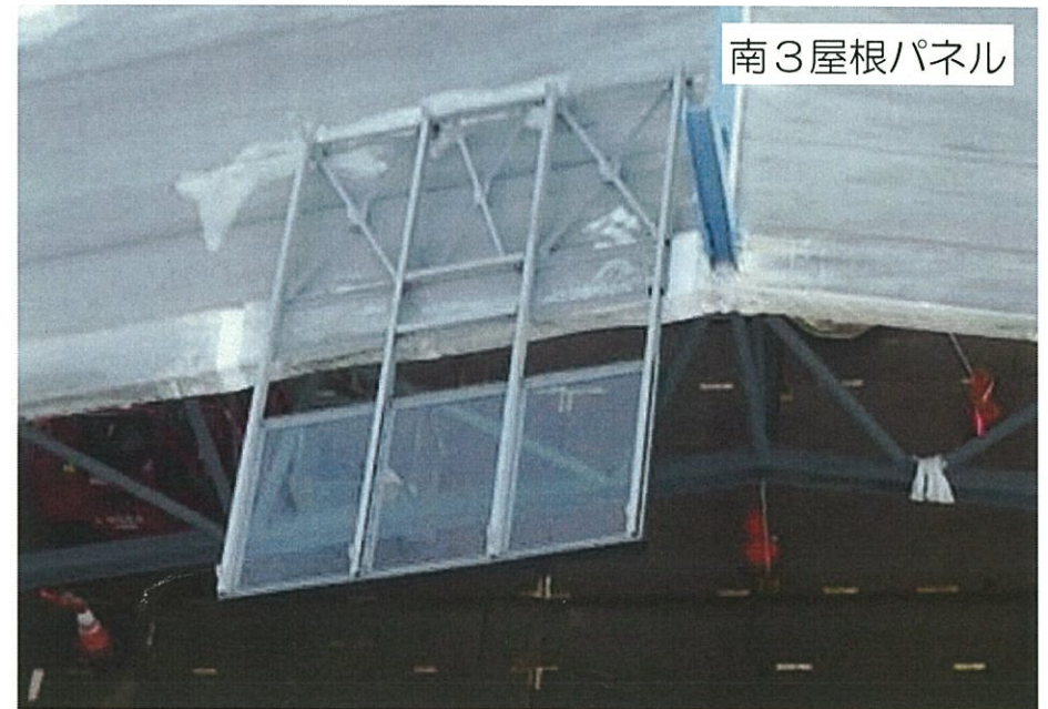
はね出し部材取り付け状況