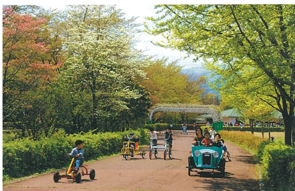
写真1 サイクルスポーツ広場

あづま総合運動公園の「サイクルスポーツ広場」、「トリムの森」の除染が終了しました。既に再オープンしている「巨石広場」・「ピクニック広場」・「木陰広場」に加えて4月19日(土)に再オープンします！ぜひお越しください！