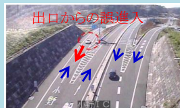
小野ICで起きた「逆走」(H23年11月)