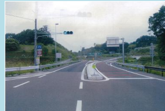
石川母畑ICで実施した逆走防止対策(路面標示と進入禁止看板の追加設置)