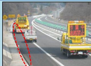
支障木処理作業状況