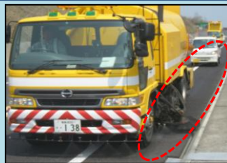
あぶくま高原道路全線の路面清掃状況