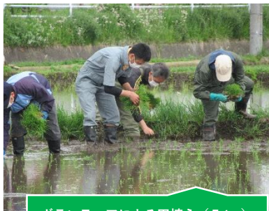
ボランティアによる田植え (5/18) 【社川小学校】

今年度は、新型コロナウイルス感染症の影響で、それぞれの学校で工夫しながらのスタートとなりました。