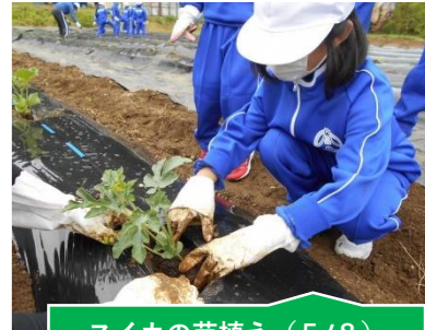
スイカの苗植え (5/8) 【高野小学校】