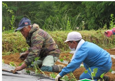
サツマイモの苗植え (5/22) 【山岡小学校】