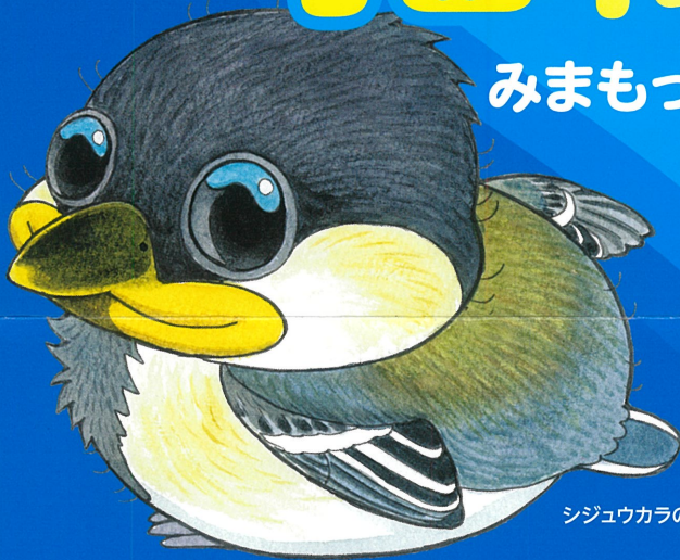
シジウカラのヒナ